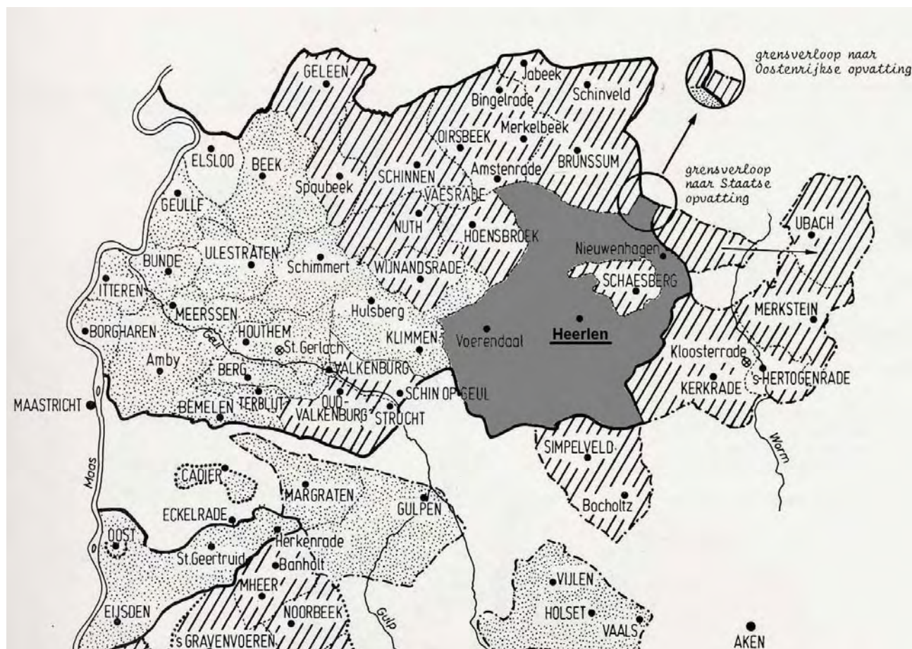
Schepenbank Heerlen in de 18 e eeuw. Schepenbank Heerlen, behoorde tot Staatse Landen van Overmaas. Staatse Landen van Overmaas. Oostenrijkse landen van Overmaas © Rijckheyt, centrum voor regionale geschiedenis.

Het Staatse gedeelte van de Landen van Overmaas, waar het grootste gedeelte van Heerlen ook onder viel en waar wij ons hier in deze reader op zullen richten, is dus sinds 1661 'Nederland' grondgebied . De schepenbank Heerlen viel dus onder het Land van Valkenburg en dat Land van Valkenburg bestond weer uit verschillende schepenbanken. Rond het gebied van Heerlen, het oostelijk gedeelte dus van het land van Valkenburg, vormde Heerlen de hoofdbank en de daarom heen liggende andere banken waren voor wat betreft de rechtspraak onderhavig aan Heerlen en werden daarom onderbanken genoemd. In 1661 werden deze onderbanken waar ook Hoensbroek onder viel, aan Spanje toegewezen. En zo kwam het dat de schepenbank van Heerlen voor het grootste gedeelte werd omringd door vreemde mogendheden, gebieden waar een andere munt gold, een andere bestuur, andere wetten en andere rechtspraak.